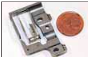
Wie hoch die Fertigungspräzision ist, zeigt der Größenvergleich mit einer Ein-Cent-Münze.