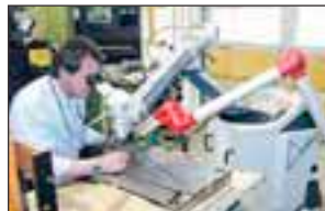
Mit dem mobilen Laserschweißen kommen die Experten von SR-Erodieretechnik direkt zum Kunden.