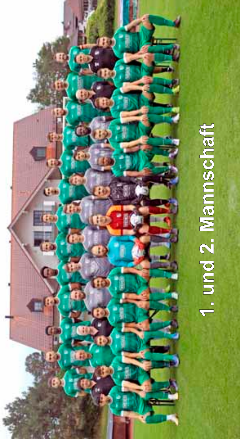
1. und 2. Mannschaft