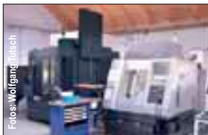
Für die Präzisionsfertigung kommen Hightech-Maschinen zum Einsatz. Links im Bild die neue Makino V33i.

Schleifen | Formenbau | Werkzeugkonstruktion | Senkerodieren CAD-CAM Technik | Drahterodieren | Laserschweißen | Fräsen