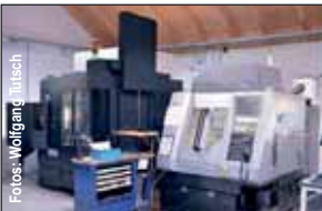
Für die Präzisionsfertigung kommen Hightech-Maschinen zum Einsatz. Links im Bild die neue Makino V33i.

Schleifen | Formenbau | Werkzeugkonstruktion | Senkerodieren CAD-CAM Technik | Drahtrodieren | Laserschweißen | Fräsen