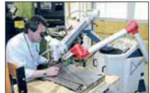
Mit dem mobilen Laserschweißen kommen die Experten von SR-Erodier-technik direkt zum Kunden.