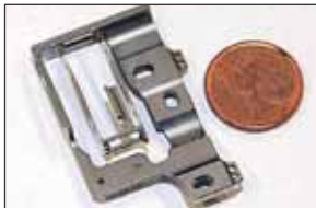
Wie hoch die Fertigungspräzision ist, zeigt der Größenvergleich mit einer Euro-Münze.