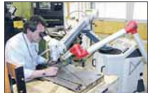
Mit dem mobilen Laserschweißen kommen die Experten von SR-Erodier-technik direkt zum Kunden.