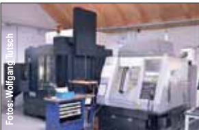
Für die Präzisionsfertigung kommen Hightech-Maschinen zum Einsatz. Links im Bild die neue Makino V33i.

Schleifen | Formenbau | Werkzeugkonstruktion | Senkerodieren CAD-CAM Technik | Drahtrodieren | Laserschweißen | Fräsen